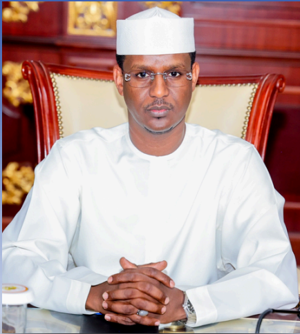
S.E. / H.E. ABAKAR ROZZI TEGUIL

Ministre du Développement Touristique, de la Culture et de l'artisanat Minister of Tourism Development, Culture and Handicrafts