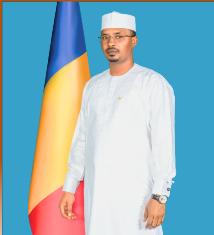
S.E. Maréchal MAHAMAT IDRISSE DEBY ITNO / H.E. Marshal MAHAMAT IDRISSE DEBY ITNO

Président de la République du Tchad President of the Republic of Tchad