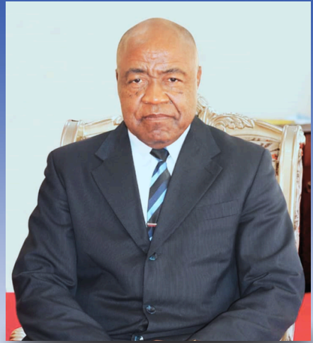
S.E. / H.E. Ismaël BIDOUNG MKPATT

Ministre du Développement Touristique, de la Culture et de l'artisanat Minister of Tourism Development, Culture and Handicrafts