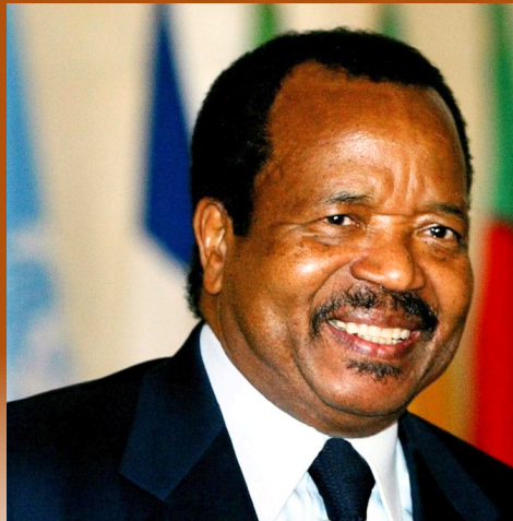
S.E. PAUL BIYA / H.E. PAUL BIYA

Président de la République du Tchad President of the Republic of Tchad